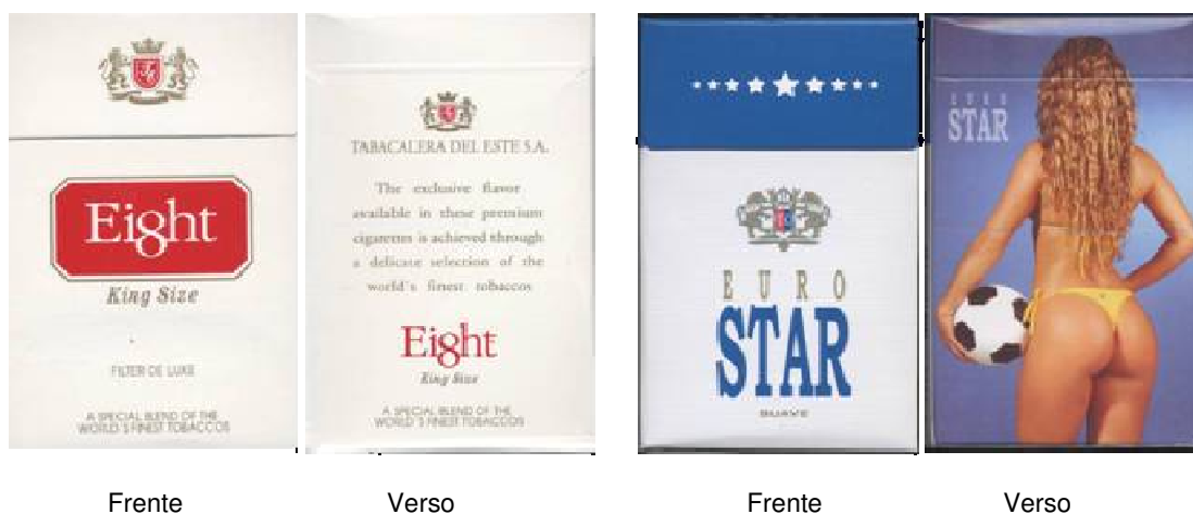
Figura 6.1.1 – Produtos do contrabando não obedecem às normas da legislação brasileira

Atualmente, a embalagem dos produtos do contrabando demonstra boa qualidade no que diz respeito à apresentação e acabamento. Possui aparência semelhante aos produtos fabricados no País, mas estão à margem de qualquer norma da legislação brasileira, seja quanto à tributação, à obrigatoriedade de imprimir advertências e código de barras nas embalagens ou à aposição do selo de controle da Receita Federal. Adicionalmente, é importante ressaltar que os controles fitossanitários são, evidentemente, negligenciados.