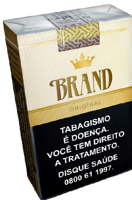
Figura 3.2.1 – Parte frontal de embalagem de cigarro formal após implantação das medidas

De acordo com as normas propostas, embalagens com tamanho maior que o padrão deverão ter a imagem proporcionalmente ampliada e eventual área remanescente deverá permanecer em branco, proibida a impressão de qualquer outra informação.