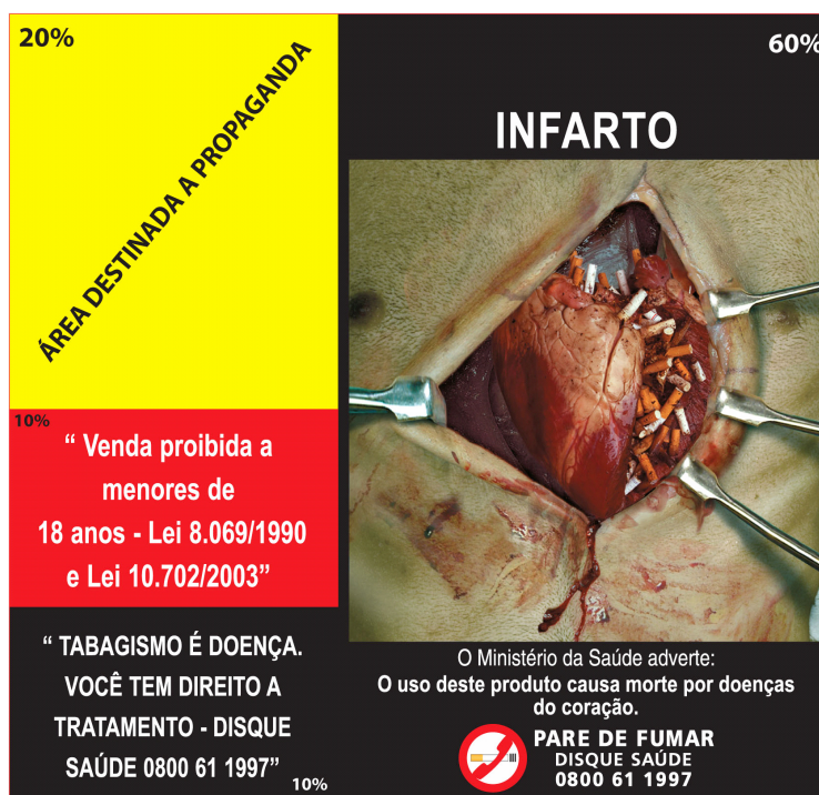
Figura 3.3.1 – Restrições à comunicação em pontos de venda

O diagrama a seguir mostra esquematicamente o formato exigido para que o material de divulgação possa ser exibido em pontos de venda.